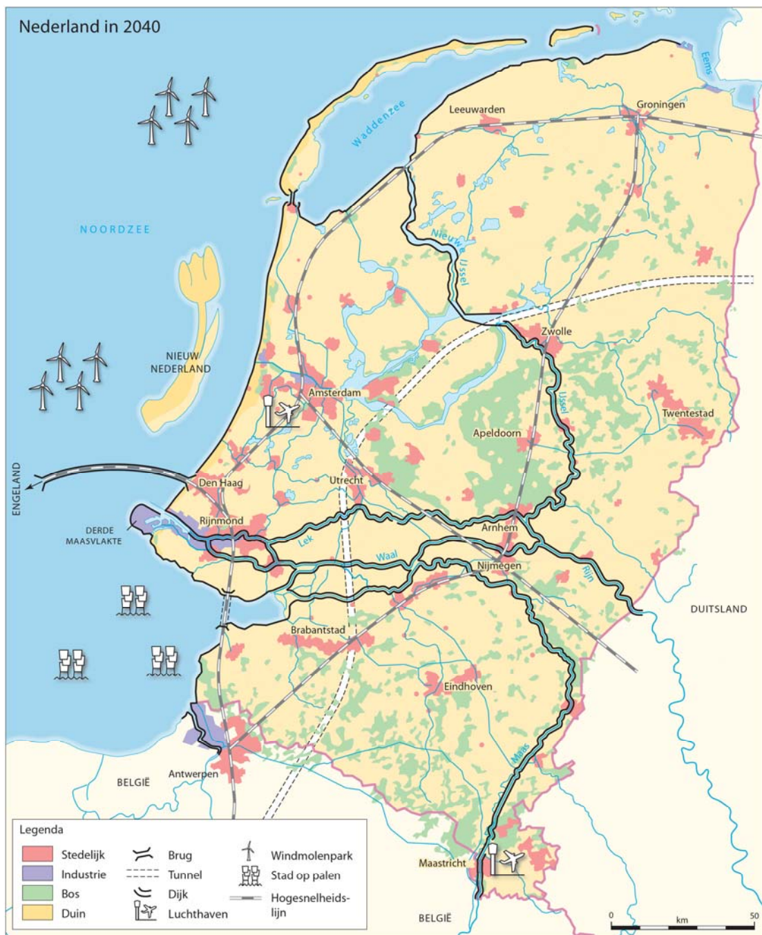
Kaart 1: Samengestelde kaart Nederland in 2040

Teken een kaart van Nederland in 2040 met legenda en schrijf er een toelichting bij. Die opdracht legden aardrijkskundedocenten op 25 scholen afgelopen winter voor aan hun leerlingen. Een basiskaart van Nederland met grenzen, steden en rivieren vormde de ondergrond om mee aan de slag te gaan. Bijna 1000 leerlingen van 12 tot 15 jaar deden mee en produceerden, individueel of in groepjes, 700 kaarten van Nederland. Na analyse van de 700 kaarten door geografen ontwierp een cartograaf van UvA-Kaartenmakers Amsterdam een samengestelde kaart op grond van elementen die in de kaarten van de leerlingen vaak voorkwamen.