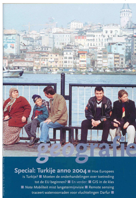
Het eerste extra dikke themanummer van Geografie stond in het teken van Turkije.

De volledige samenstelling van de redactie is te vinden in bijlage III.