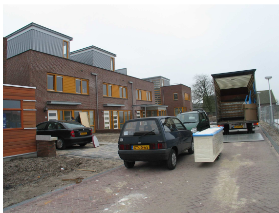
Wonen in een wijk in aanbouw: Terwijde in Leidsche Rijn.

Bijna negentig deelnemers verzamelden zich op zaterdag 25 september bij het Centraal Station in Utrecht voor de KNAG-excursie 2004. Deze voerde de deelnemers op de fiets van het station via de Utrechtse probleemwijk Kanaleneiland naar Leidsche Rijn. Twee thema's stonden centraal in de fietsroute: water en architectuur/stedenbouw. Naast een routekaart en een beschrijving van hetgeen de fietsers onderweg konden zien, waren er langs de route vier vertellers. Bij de Prins Clausbrug vertelde Oedzge Atzema (Universiteit