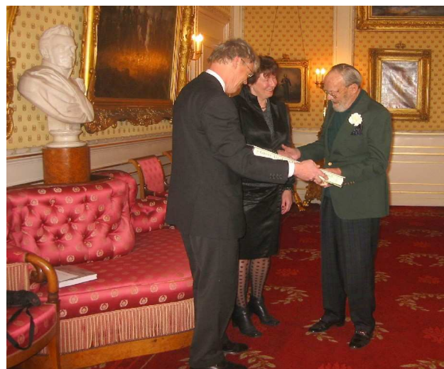
Met veel interesse nam ZKH Prins Bernhard een exemplaar van de atlas in ontvangst.

Het enthousiasme voor de atlas was overal groot. Begin 2004 was deze uitverkocht. In november 2004 verscheen een tweede druk, met extra, zeldzame kaarten (ook los verkrijgbaar als aanvulling op de eerste druk). Begin 2005 is de tweede druk inmiddels ook bijna uitverkocht. Er kan gerust gesteld worden dat de atlas in korte tijd een roemrijke status heeft behaald, in binnen- en buitenland.